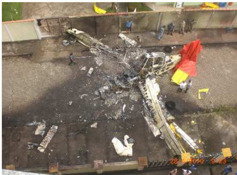
Figura 03 – Disposição final dos destroços da aeronave

A aeronave ficou totalmente destruída pelo fogo. O calor das chamas afetou o muro de uma casa e um edifício próximo.