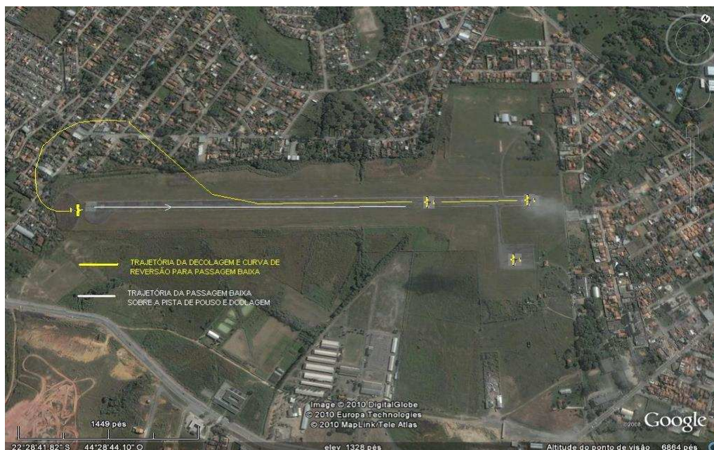
Figura 04: Representação da trajetória da decolagem, com reversão para enquadramento para passagem baixa sobre a pista, segundo relato de testemunhas.

Durante a segunda saída, o piloto decolou da cabeceira 26 e, ao cruzar a cabeceira 08, realizou uma manobra com curva à direita, revertendo em curva à esquerda (manobra conhecida como “balão”), retornando ao eixo da pista para uma passagem baixa no sentido contrário 08 / 26, conforme figura abaixo.