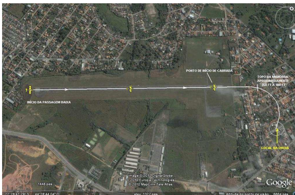
Figura 05 – Trajetória da aeronave, conforme relato de testemunhas

Dados comparativos de acidentes da frota de aeronaves AT-402, AT-502 e AT-802, nos anos de 2006 a JUN2011, período em que a frota de aeronaves AT-802 começou a crescer no Brasil.